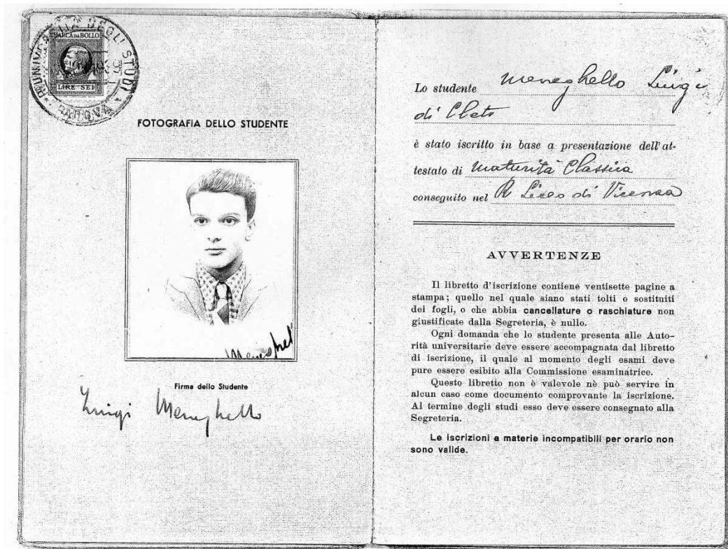
Figura 3. Libretto Universitario, 1939.